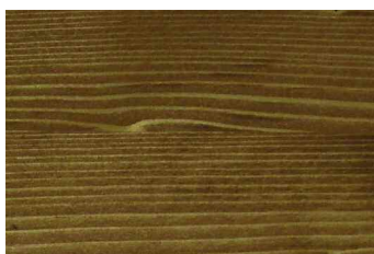
bangkirai N° 110-85