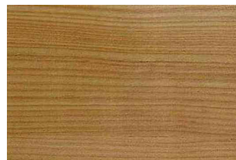
mélèze N° 110-89